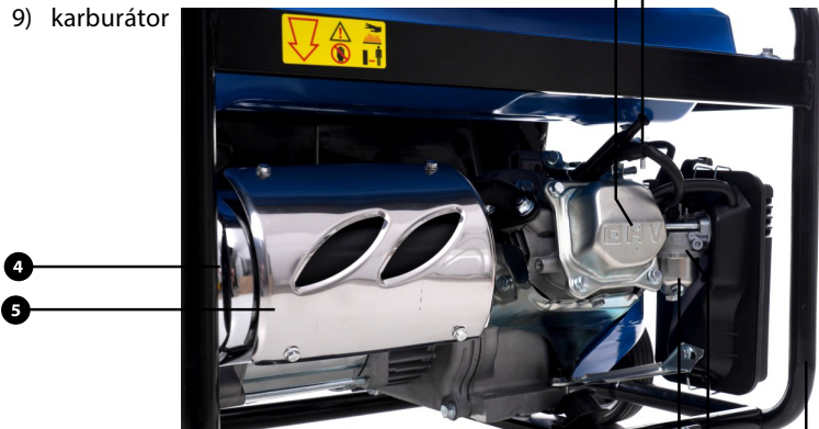
Obr. 3 a 4